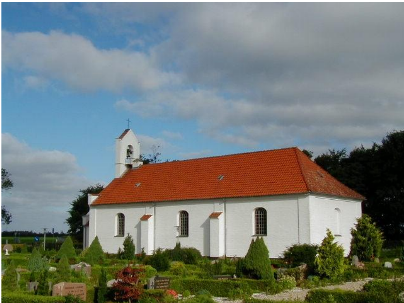
Frederiks kirke 9. august 2000.