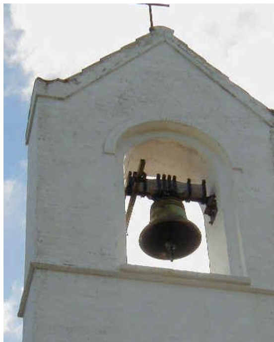
De to klokker ved Frederiks kirke. Den nye øverst og den gamle nederst.