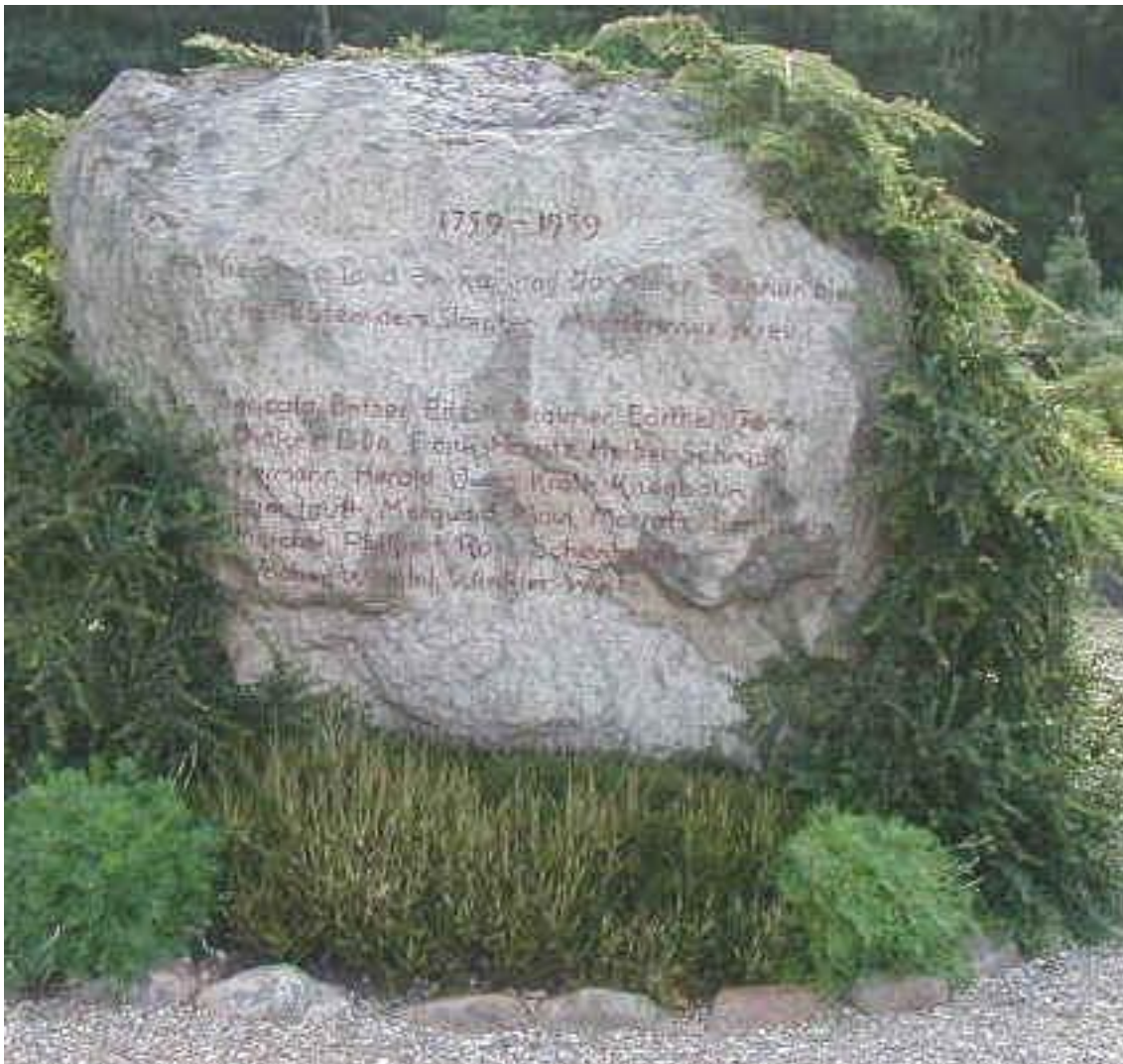
Mindestenen som står på kirkegården.