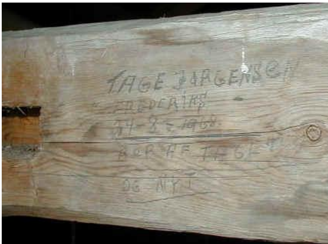
Skrevet på en bjælke på loftet.

"Herlig af graven opstod Guds ord, nådig fra himlen Guds ånd nedfor. Ved I nu hvorfor det kimer?"