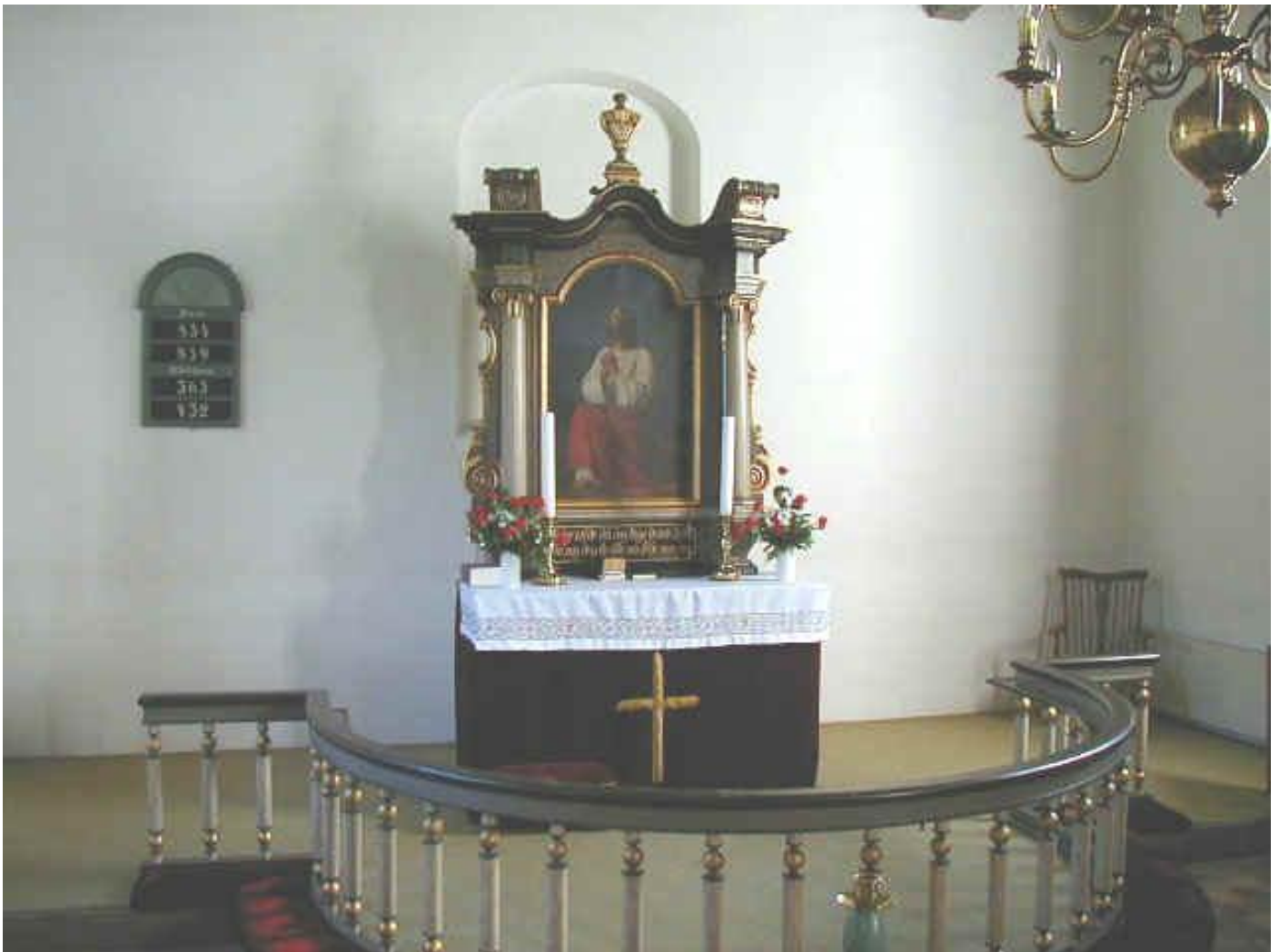
Alteret i Frederiks kirke

De første mange år var gudstjenesterne på tysk - naturligvis. Og der var to gudstjenester hver søndag en for lutheranere og en for reformerte, men ret hurtigt flyttede den reformerte præst, og de reformerte blev så en tid betjent af den reformerte præst i Fredericia, men det ebbede ud med de reformerte og i 1839 var der kun en reformert tilbage på Alheden. Alle dansktalende kirkegængere blev henvist til Karup kirke, men fra 1823 begyndte man så småt med at holde danske gudstjenester og efter den 27. februar 1870 overgik man helt til dansk i kirken, men der findes familier, der har deres tyske bibel.