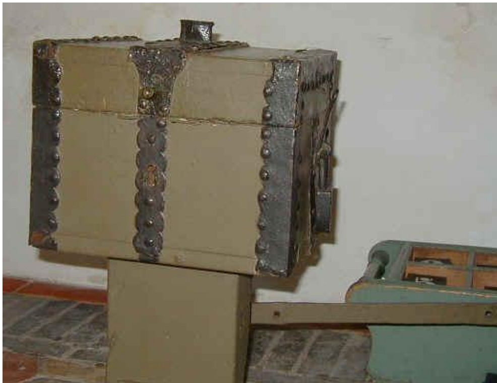
Døbefonden, der er lavet af granit og den gamle kirkebøsse, der nu står under prædikestolen